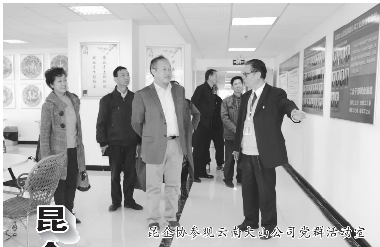
昆企协参观云南大山公司党群活动室