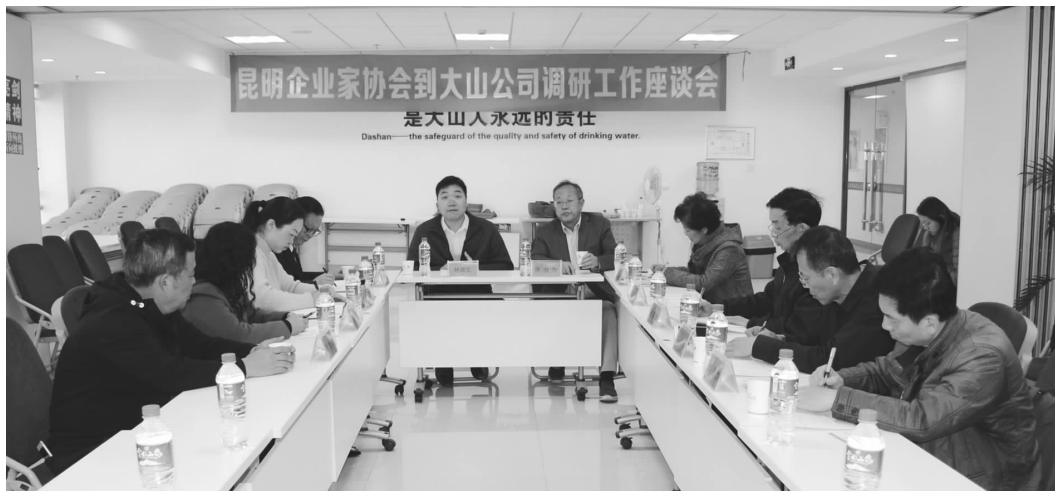
昆企协到云南大山公司调研座谈

内落后的管理资金投入更高，政府对企业的鼓励政策上往往是一刀切，外资企业得不到相应的鼓励支持。希望国家的税收优惠政策真正在外资企业得到落实，切实保护外资投资方的利益。