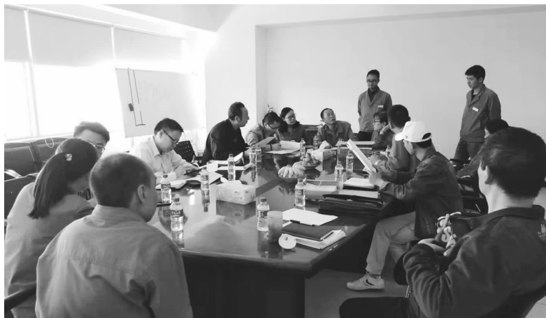
第三组到企业进行实地复验工作

根据昆明市总工会、市人社局、昆明企业家协会/企业联合会、市工商联下发的《关于对“云南省劳动关系和谐企业、园区”表彰单位开展复验工作的通知》要求，昆明市协调劳动关系第三组高度重视复验工作，昆明企业家协会作为第三组组长单位，牵头成员单位市人社局、市工信委、市商务局、市公安局、市税务局对第三组的22家企业、园区进行复验。