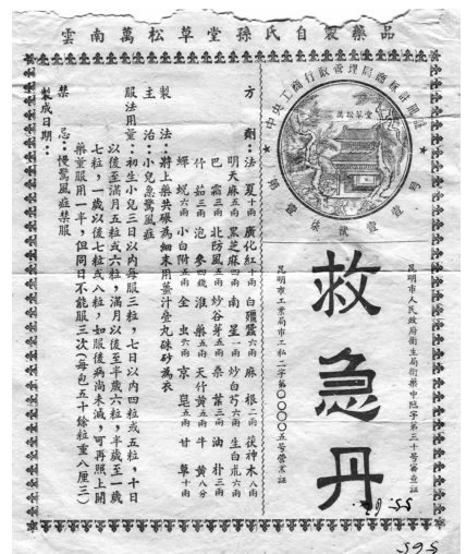
征集到的1955年云南万松草堂救急丹仿单